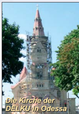
Die Kirche der DELKU in Odessa

Zur Verwirklichung dieser Ziele strebt der Verein Antonovka eine Kooperation mit dem Wohltätigkeitsfonds des „Bayerischen Hauses“ in Odessa an, der unter anderem von der „Gesellschaft für Technische Zusammenarbeit“ (GTZ) und der Diakonie der Evangelisch-Lutherischen Landeskirche Bayern getragen wird. Dieser Fonds baut seit 2001 in Odessa ein Zentrum für Sozialarbeit auf.