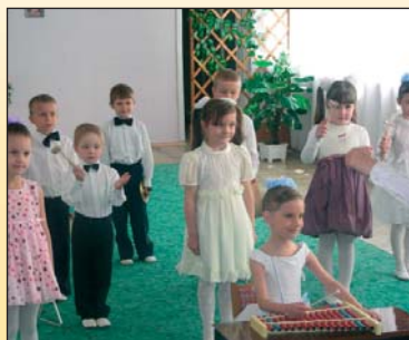
Kinder des Kindergartens 41 überraschen die deutschen Besucher mit einer Aufführung

Der Verein Antonovka erweitert einerseits die Kompetenzen dieses Zentrums und kann andererseits die vorhandenen Erfahrungen, Kenntnisse und verlässlichen Kontakte für seine Projekte intensiv nutzen. Eine vertrauensvolle Partnerschaft mit einer ansässigen Organisation ist für eine erfolgreiche Arbeit in der Ukraine unerlässlich. Zudem wird der Verein eng mit der Deutschen Evangelisch-Lutherischen Kirche in der Ukraine (DELKU) zusammenarbeiten.