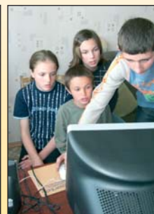
Kinder in Antonovka freuen sich über den gespendeten PC