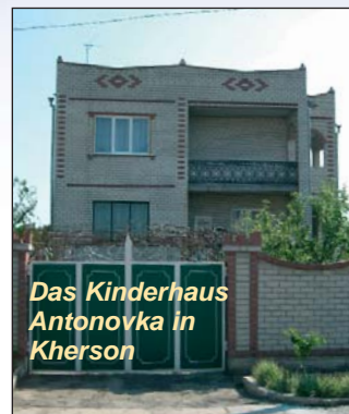
Das Kinderhaus Antonovka in Kherson

Der Verein Antonovka erweitert einerseits die Kompetenzen dieses Zentrums und kann andererseits die vorhandenen Erfahrungen, Kenntnisse und verlässlichen Kontakte für seine Projekte intensiv nutzen. Eine vertrauensvolle Partnerschaft mit einer ansässigen Organisation ist für eine erfolgreiche Arbeit in der Ukraine unerlässlich. Zudem wird der Verein eng mit der Deutschen Evangelisch-Lutherischen Kirche in der Ukraine (DELKU) zusammenarbeiten.