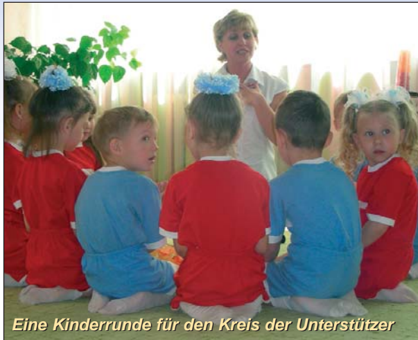
Eine Kinderrunde für den Kreis der Unterstützer

Zur Bewältigung der genannten Aufgaben und Projekte braucht der Verein Antonovka außer Geduld, Beharrlichkeit und zuverlässigen Partnern in der Ukraine die Hilfsbereitschaft Anteil nehmender und engagierter Bürgerinnen und Bürger unseres Landes.